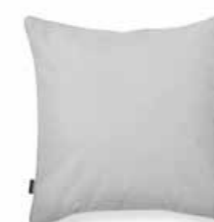
Elisa 100527 50 x 50 cm hellgrau