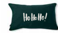
Elisa 100718 30 x 50 cm waldgrün | weiß