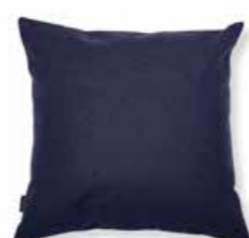
Stella 100584 50 x 50 cm dunkelblau