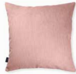
Cara 100653 50 x 50 cm altrosa