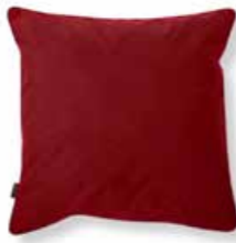
Elisa 100479 50 x 50 cm bordeaux