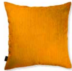
Cara 100656 50 x 50 cm senf