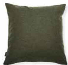
Stella 100602 50 x 50 cm flaschengrün