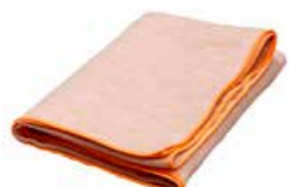
Tischläufer 200334 50 x 150 cm rosa | neonorange