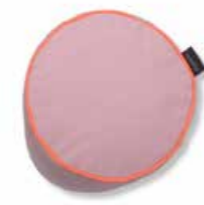
Elisa 100429 20 x 50 cm altrosa | neonorange

UNSERE KISSENFORMATE 20 x 50 cm 15 x 40 cm sowie die passenden Inletts (siehe Preisliste) + WEITERE FARBEN