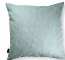
Cara 100629 50 x 50 cm salbei