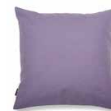
Stella 100566 50 x 50 cm helllila