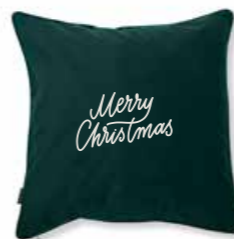
Elisa 100723 50 x 50 cm waldgrün | weiß