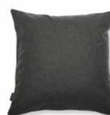
Stella 100714 50 x 50 cm dunkelgrau