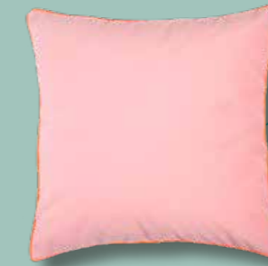
Elisa 100324 50 x 50 cm altrosa | neonorange