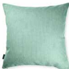
Cara 100638 50 x 50 cm mint