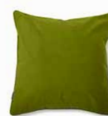
Elisa 100521 50 x 50 cm grün