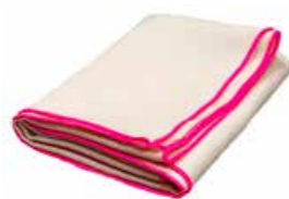
Tischläufer 200335 50 x 150 cm creme | neonpink