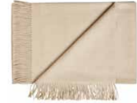
Amanda 200341 130 x 200 cm creme