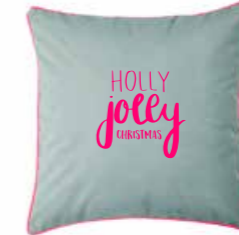
Elisa 100727 50 x 50 cm mint | neonpink