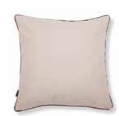
Stella 100554 50 x 50 cm beige | braun