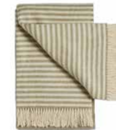
Danaja 200348 130 x 200 cm mintgrün