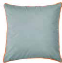
Elisa 100330 50 x 50 cm mint | neonorange