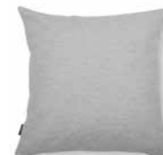
Stella 100590 50 x 50 cm hellgrau