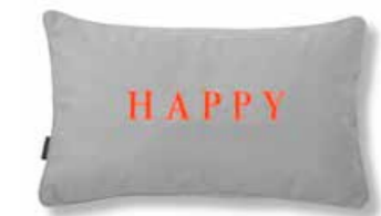
Elisa 100708 30 x 50 cm hellgrau | neonorange