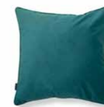
Elisa 100509 50 x 50 cm blaugrün