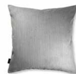
Cara 100623 50 x 50 cm grau