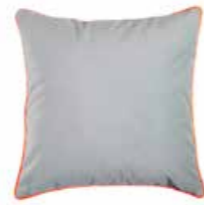
Elisa 100345 50 x 50 cm hellgrau | neonorange