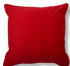
Elisa 100473 50 x 50 cm rot