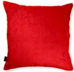
Cara 100650 50 x 50 cm rot