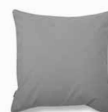
Elisa 100530 50 x 50 cm dunkelgrau