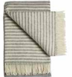
Danaja 200347 130 x 200 cm hellgrau