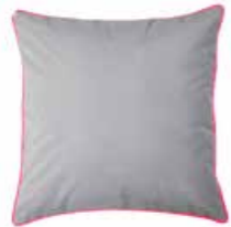
Elisa 100349 50 x 50 cm hellgrau | neopink