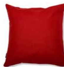
Stella 100575 50 x 50 cm rot