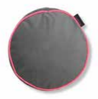
Elisa 100439 20 x 50 cm dunkelgrau | neopink