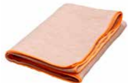
Geschirrtuch 200328 50 x 70 cm rosa | neonorange