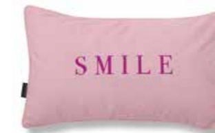
Elisa 100704 30 x 50 cm altrosa | lila