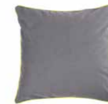
Elisa 100342 50 x 50 cm dunkelgrau | neongelb