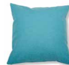
Stella 100560 50 x 50 cm türkis