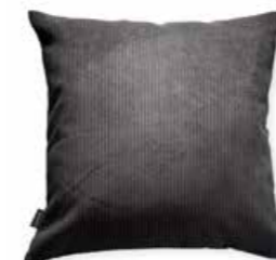
Cara 100626 50 x 50 cm anthrazit