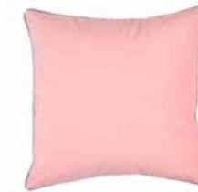
Elisa 100323 50 x 50 cm altrosa | grau