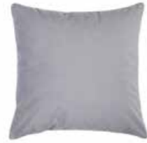
Elisa 100346 50 x 50 cm hellgrau | weiß