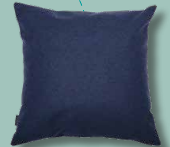
Stella 100578 50 x 50 cm jeansblau