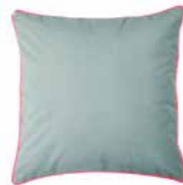
Elisa 100359 50 x 50 cm mint | neopink