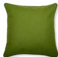
Stella 100536 50 x 50 cm grün | flaschengrün