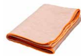
Tischdecke 200355 150 x 250 cm rosa | neonorange