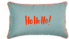
Elisa 100721 30 x 50 cm mint | neonorange