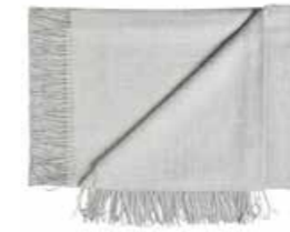
Amanda 200342 130 x 200 cm hellgrau