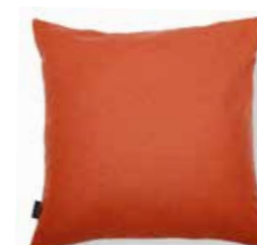
Stella 100572 50 x 50 cm orange