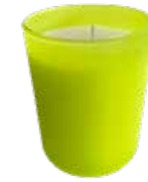
Kerze 200358 10 x 8 cm neongelb Lemon | Bergamot