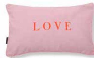
Elisa 100703 30 x 50 cm altrosa | neonorange