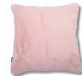
Bella 100617 50 x 50 cm pink