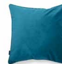
Elisa 100515 50 x 50 cm petrol