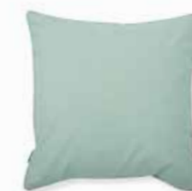
Elisa 100500 50 x 50 cm mint