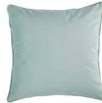
Elisa 100331 50 x 50 cm mint | grau