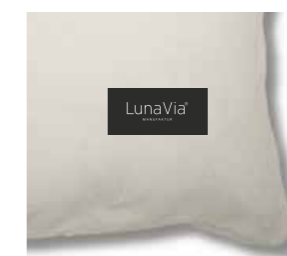
Bella 200336 140 x 200 cm creme

Diese Decke eignet sich nicht nur hervorragend zum Kuscheln, sondern auch als wunderbarer Überwurf für Ihr Bett.