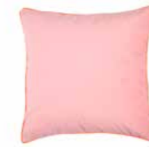
Elisa 100324 50 x 50 cm altrosa | neonorange