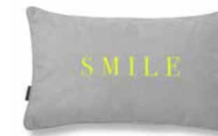
Elisa 100707 30 x 50 cm hellgrau | neongelb