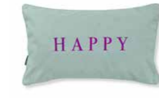
Elisa 100710 30 x 50 cm mint | lila