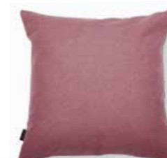
Stella 100569 50 x 50 cm sorbet