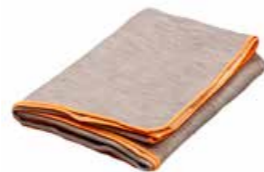
Geschirrtuch 200327 50 x 70 cm beige | neonorange