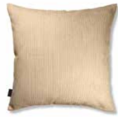
Cara 100665 50 x 50 cm beige