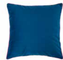
Elisa 100368 50 x 50 cm blau | neonpink