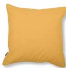
Elisa 100488 50 x 50 cm Gelb