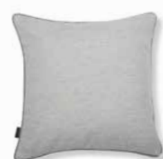
Stella 100545 50 x 50 cm hellgrau | grau