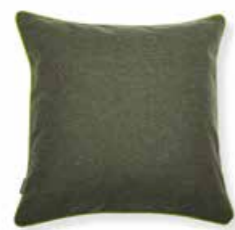
Stella 100539 50 x 50 cm flaschengrün | grün