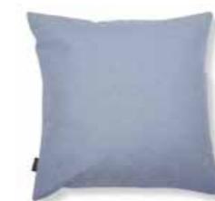
Stella 100563 50 x 50 cm hellblau