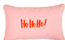
Elisa 100720 30 x 50 cm altrosa | neonorange