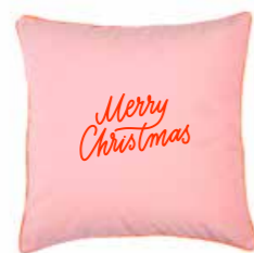
Elisa 100728 50 x 50 cm altrosa | neonorange