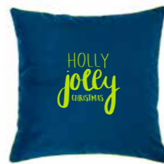
Elisa 100730 50 x 50 cm blau | neongelb