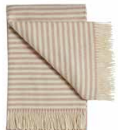
Danaja 200349 130 x 200 cm altrosa