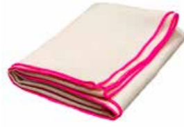
Geschirrtuch 200329 50 x 70 cm creme | neonpink