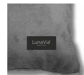
Bella 200350 140 x 200 cm anthrazit