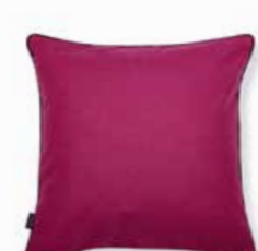
Stella 100548 50 x 50 cm fuchsia | dunkelblau