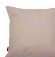
Stella 100596 50 x 50 cm beige