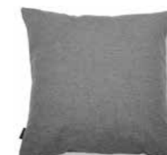
Stella 100593 50 x 50 cm grau