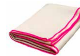
Tischdecke 200356 150 x 250 cm creme | neonpink