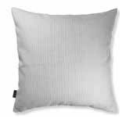
Cara 100620 50 x 50 cm hellgrau