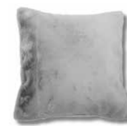
Bella 100614 50 x 50 cm silber