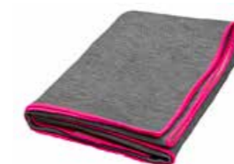
Tischdecke 200352 150 x 250 cm anthrazit | neonpink