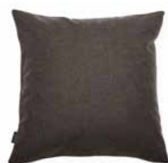
Stella 100599 50 x 50 cm braun