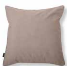
Elisa 100494 50 x 50 cm taube