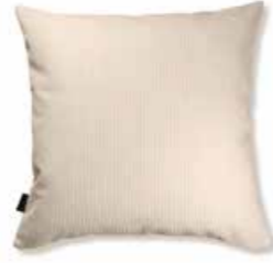
Cara 100668 50 x 50 cm creme