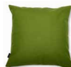
Stella 100605 50 x 50 cm grün