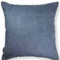
Cara 100635 50 x 50 cm jeansblau