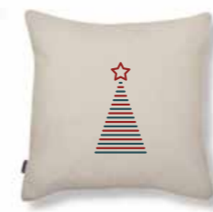
Elisa 100725 50 x 50 cm creme | mehrfarbig