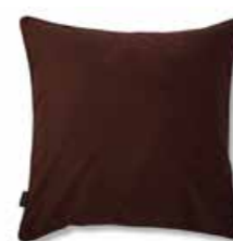
Elisa 100497 50 x 50 cm braun