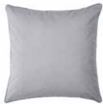
Elisa 100357 50 x 50 cm hellgrau | blau