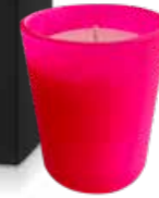
Kerze 200357 10 x 8 cm neonpink Flower | Cedarwood