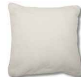
Bella 100611 50 x 50 cm creme

„Bella“ ist ein absolutes Muss für jedes Zuhause, besonders in der kühlen Jahreszeit.