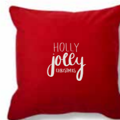
Elisa 100724 50 x 50 cm bordeaux | weiß