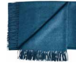
Amanda 200339 130 x 200 cm blau