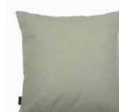
Stella 100608 50 x 50 cm mint