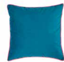
Elisa 100353 50 x 50 cm petrol | neonpink