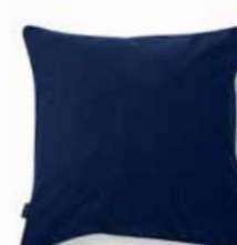
Elisa 100512 50 x 50 cm blau