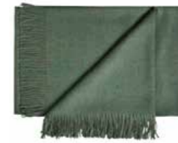
Amanda 200344 130 x 200 cm flaschengrün