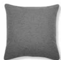
Stella 100542 50 x 50 cm grau | hellgrau