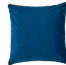
Elisa 100370 50 x 50 cm blau | neonorange