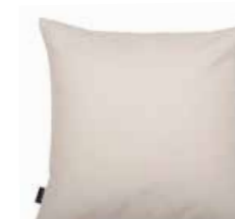
Stella 100587 50 x 50 cm creme