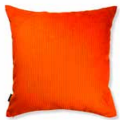
Cara 100647 50 x 50 cm orange