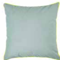
Elisa 100329 50 x 50 cm mint | neongelb