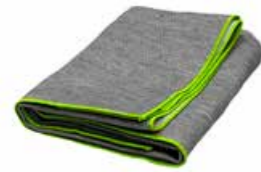
Geschirrtuch 200323 50 x 70 cm anthrazit | neongrün