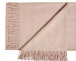
Amanda 200340 130 x 200 cm altrosa