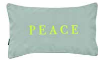
Elisa 100709 30 x 50 cm mint | neongelb