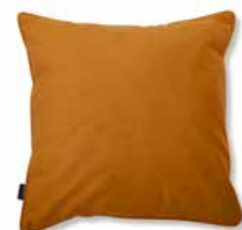
Elisa 100482 50 x 50 cm ocker