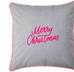
Elisa 100731 50 x 50 cm hellgrau | neonpink