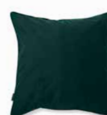
Elisa 100518 50 x 50 cm waldgrün