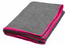
Geschirrtuch 200324 50 x 70 cm anthrazit | neonpink