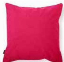
Elisa 100470 50 x 50 cm pink