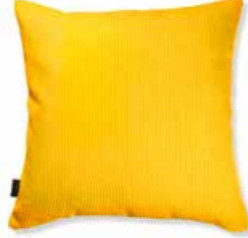
Cara 100659 50 x 50 cm gelb