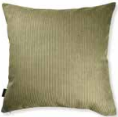
Cara 100644 50 x 50 cm olive