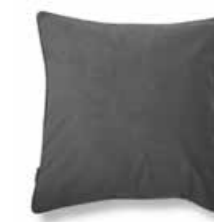
Elisa 100533 50 x 50 cm anthrazit