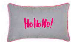
Elisa 100722 30 x 50 cm hellgrau | neonpink