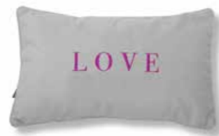
Elisa 100706 30 x 50 cm hellgrau | lila