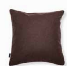
Stella 100557 50 x 50 cm braun | beige