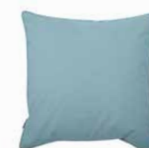
Elisa 100503 50 x 50 cm aqua