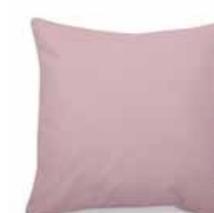
Elisa 100506 50 x 50 cm altrosa