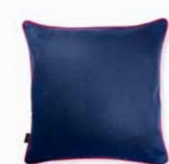
Stella 100551 50 x 50 cm dunkelblau | fuchsia