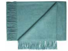
Amanda 200345 130 x 200 cm türkis