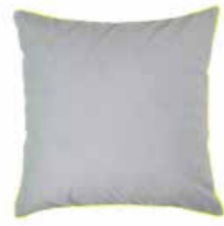
Elisa 100350 50 x 50 cm hellgrau | neongelb