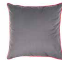
Elisa 100341 50 x 50 cm dunkelgrau | neonpink