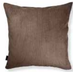
Cara 100662 50 x 50 cm braun