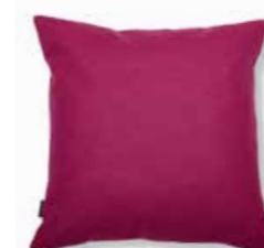
Stella 100581 50 x 50 cm fuchsia