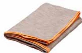
Tischläufer 200332 50 x 150 cm beige | neonorange