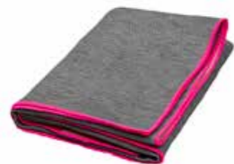
Tischläufer 200331 50 x 150 cm anthrazit | neonpink