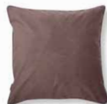
Elisa 100467 50 x 50 cm kakao