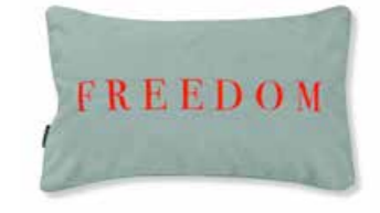
Elisa 100711 30 x 50 cm mint | neonorange