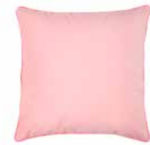
Elisa 100325 50 x 50 cm altrosa | neonpink