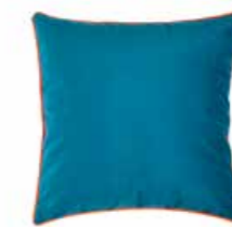
Elisa 100335 50 x 50 cm petrol | neonorange