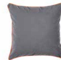
Elisa 100358 50 x 50 cm dunkelgrau | neonorange