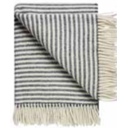
Danaja 200346 130 x 200 cm blau