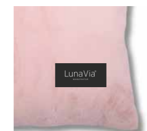
Bella 200338 140 x 200 cm pink