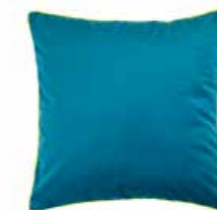
Elisa 100336 50 x 50 cm petrol | neongelb