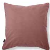
Elisa 100464 50 x 50 cm mauve