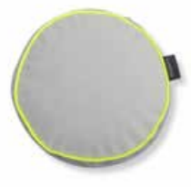
Elisa 100447 20 x 50 cm hellgrau | neongelb