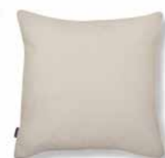
Elisa 100491 50 x 50 cm creme