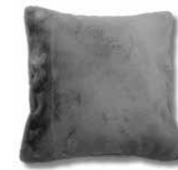
Bella 100717 50 x 50 cm anthrazit