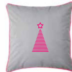
Elisa 100729 50 x 50 cm hellgrau | neonpink