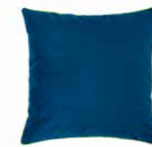
Elisa 100369 50 x 50 cm blau | neongelb