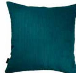
Cara 100641 50 x 50 cm petrol