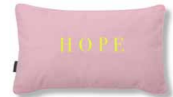
Elisa 100705 30 x 50 cm altrosa | neongelb