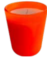
Kerze 200359 10 x 8 cm neonorange Oud | Bergamot