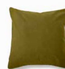
Elisa 100524 50 x 50 cm olive