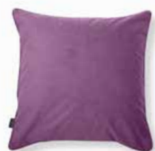
Elisa 100476 50 x 50 cm flieder