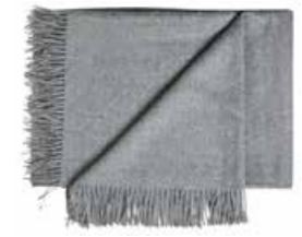
Amanda 200343 130 x 200 cm dunkelgrau