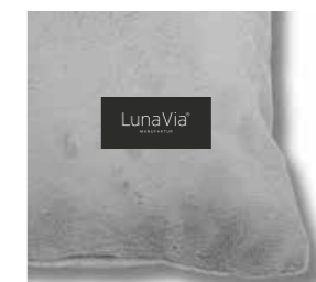
Bella 200337 140 x 200 cm silber