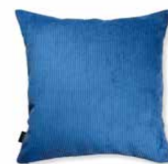
Cara 100632 50 x 50 cm blau