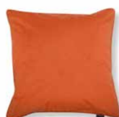
Elisa 100485 50 x 50 cm orange