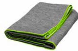
Tischläufer 200330 50 x 150 cm anthrazit | neongrün