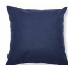
Stella 100578 50 x 50 cm jeansblau