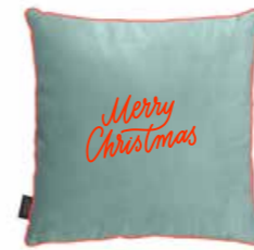
Elisa 100726 50 x 50 cm mint | neonorange