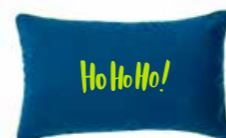
Elisa 100719 30 x 50 cm blau | neongelb